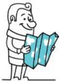
Identify your favorite place