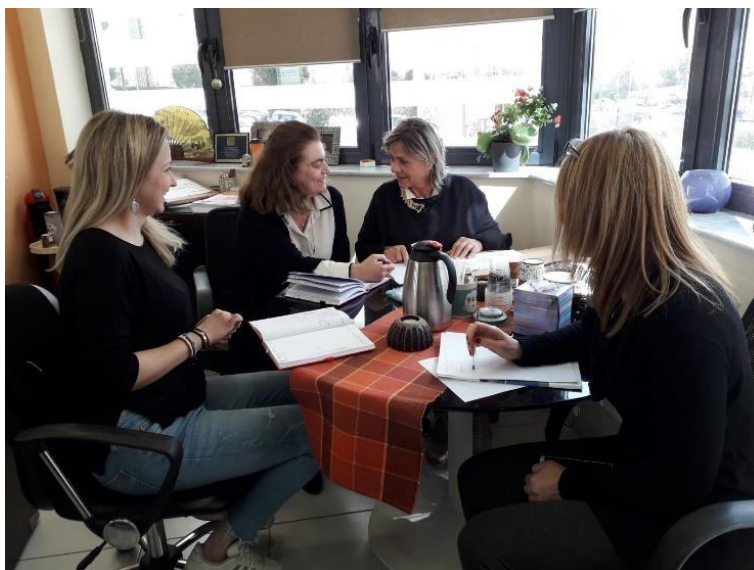
Sestanek CERTH-PED Epirus

Uvodni sestanek projekta SUSTOURISMO je bil napovedan za 27. in 28. februar 2020, vendar smo ga morali preklicati zaradi izbruha covid-19 in vseh omejitev, ki so bile uvedene za zajezitev širjenja pandemije. Namesto tega je vodilni partner z vsakim partnerjem posebej opravil sestanek prek Skypa, razen v primeru PED Epirus, pri katerem je sestanek potekal v prostorih centra CERTH. Na teh sestankih so potekale razprave o osnutkih zasnove in izvedbe posameznih pilotnih primerov s ciljem zagotoviti, da bi vsi partnerji imeli skupen pristop in trdne temelje za promocijo trajnostnega turizma na podlagi trajnostne mobilnosti v zadevnih pilotnih območjih. V razpravah so bila razjasnjena vodstvena in finančna vprašanja, s čimer je bilo zagotovljeno, da bodo vsi partnerji med trajanjem projekta upoštevali ključne dejavnike za ustrezno izvedbo projekta.