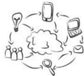
Share & Win