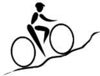
Bike to it