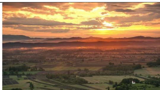
Krajski park Ljubljansko barje

Pilotni projekt bo v Ljubljani, kjer združujeta moči dva različna partnerja projekta SUSTOURISMO, osredotočen na izboljšanje privlačnosti kolesarskih in železniških poti od glavne železniške postaje do krajevnih narodnih parkov na podlagi razvoja trajnostnega kroga okoli Ljubljanskega barja.