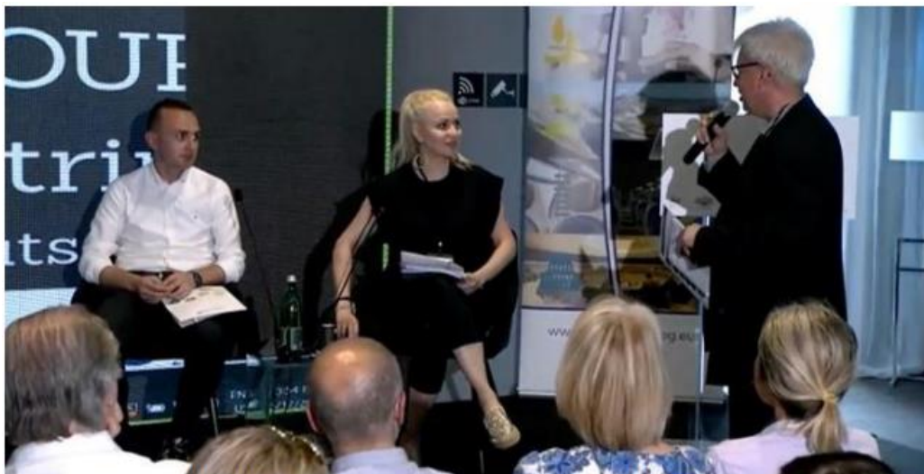
Slika 2: SUSTOURISMO predstavniki projekta na letnem ADRION dogodku, 2022

17. maja 2022 je bil projekt SUSTOURISMO predstavljen na letnem dogodku ADRION, ki je potekal v okviru 7. foruma Strategije EU za Jadransko in Jonsko regijo (EUSAIR) v Tirani (Albanija). Predstavniki projekta SUSTOURISMO so se pridružili panelu o pametni in trajnostni mobilnosti v okviru prispevka programa Interreg ADRION k Zelenemu dogovoru EU: izkušnje s praksami obnovljivih virov energije in energetske učinkovitosti ter zelene mobilnosti na jadransko-jonskem območju ter razpravljali o naslednjih korakih povezljivosti in trajnosti programa ADRION. Na panelu so sodelovali predstavniki projektov Inter-Connect (PLUS), TRIBUTE, ENERMOB in SUSTOURISMO, ki se sofinancirajo v okviru programa Interreg ADRION.