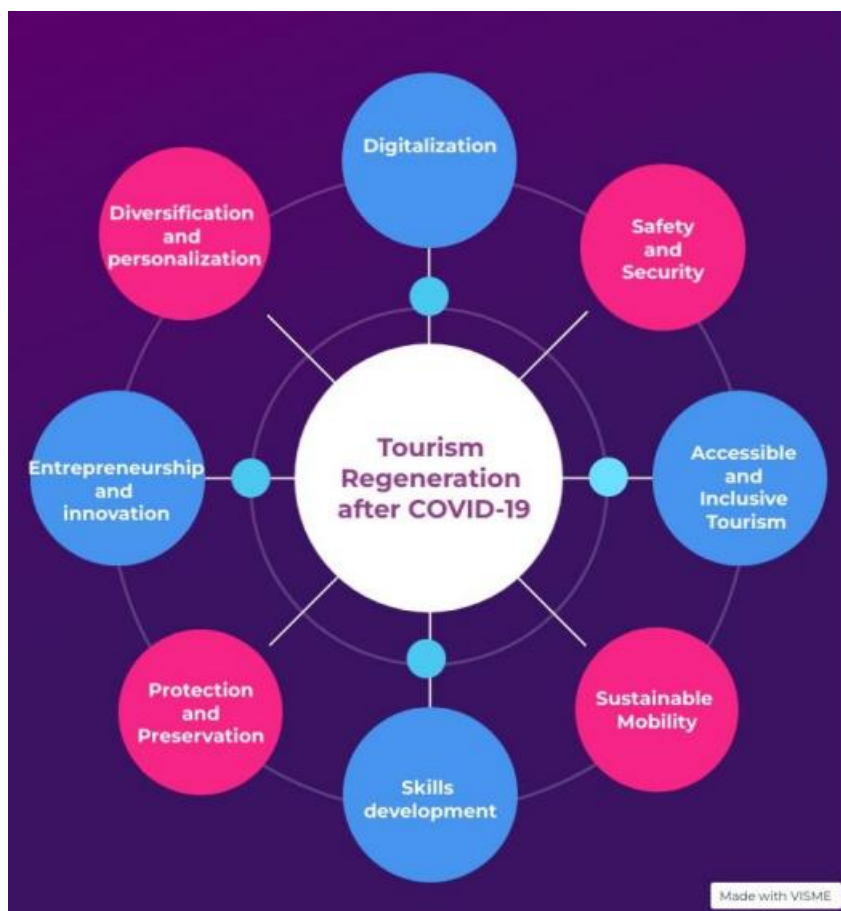
Slika 3: Prednostne naloge za obnovo turizma po COVID-19, kot jih je določil podskupinski strateški dokument

Za več informacij, si lahko strateški dokument ogledate na spodnji povezavi: